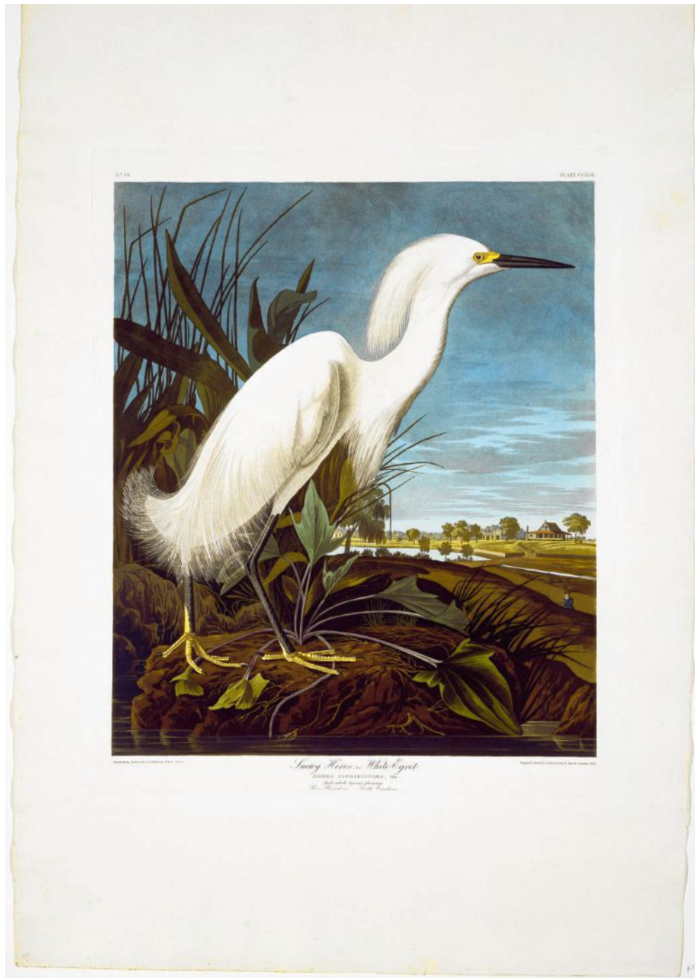
Afbeelding van een Amerikaanse kleine zilvreiger uit 1835.